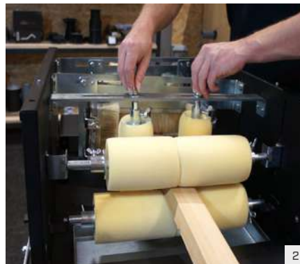
Schwämme an die Dimensionen des Werkstückes anpassen und mittels Schrauben fixieren.