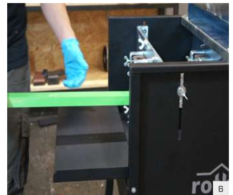
Streichvorgang starten: Ausgüsse öffnen und Rollen mit Farbe vollsaugen lassen. Anschließend Werkstücke urchschieben.