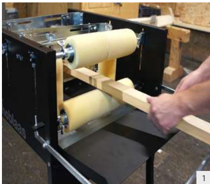
Werkstück in den Streichautomaten einlegen.