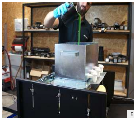
Farbe einfüllen. Evtl vorher homogen mischen.