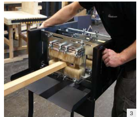
Bürsten an die Dimensionen des Werkstückes anpassen und mittels Schrauben fixieren.