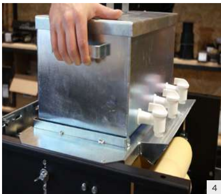
Farbbehälter aufsetzen und sicherstellen, dass die Ausgüsse verschlossen sind. Auffangeimer unten anhängen.